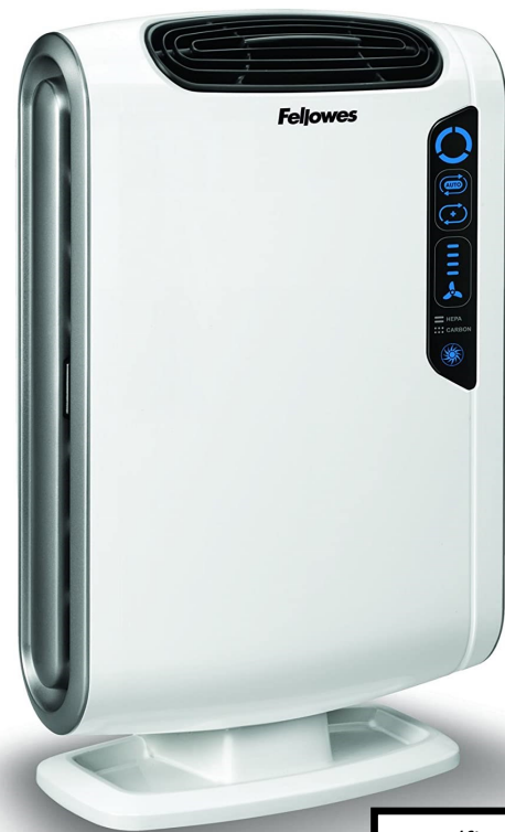
DX55 (fino 18mq)