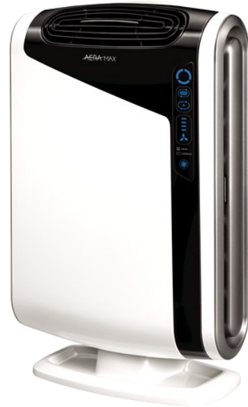
DX95 (fino 28mq)